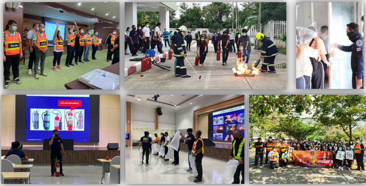
Fire suppression drill and fire evacuation