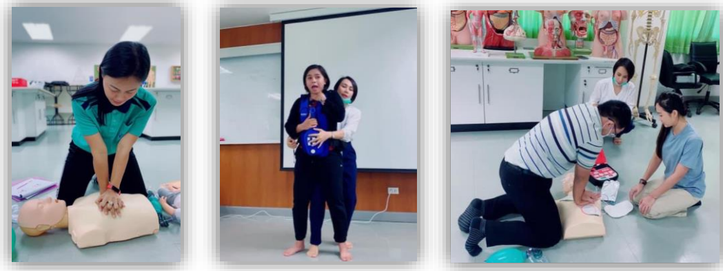
Training to educate and practice basic life saving skills