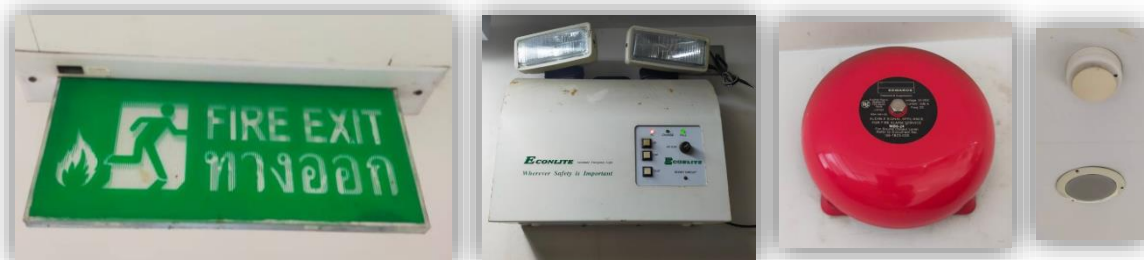
Emergency Button/Fire Alarm/Springer Water System/Fire Water System