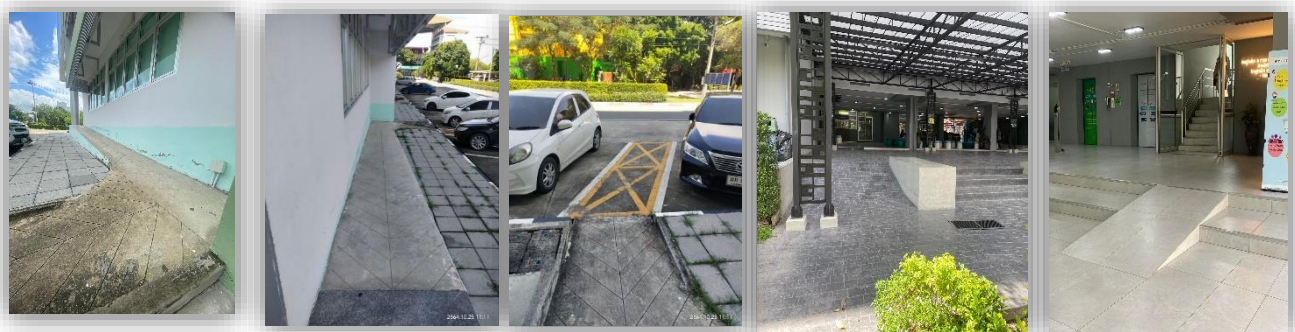
Ramps with blocking areas to prevent parking