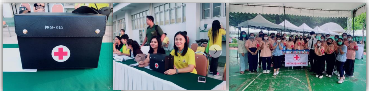
The medical unit moves